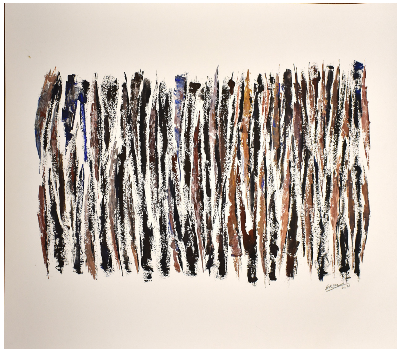
GOUACHE GOUACHE SOBRE PAPEL 110 x 75 CM 2021 R$4.625