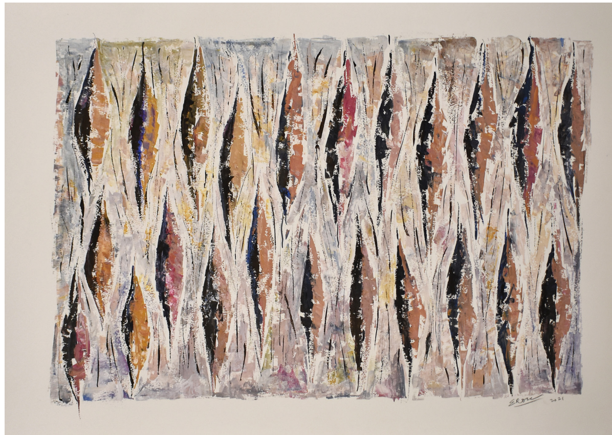
GOUACHE GOUACHE SOBRE PAPEL 110 x 75 CM 2021 R$4.375