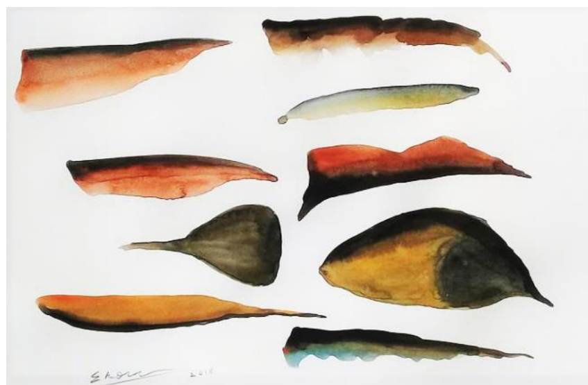
ESTUDO FORMAS AQUARELA SOBRE PAPEL 30 x 40 CM 2020 R$1.750