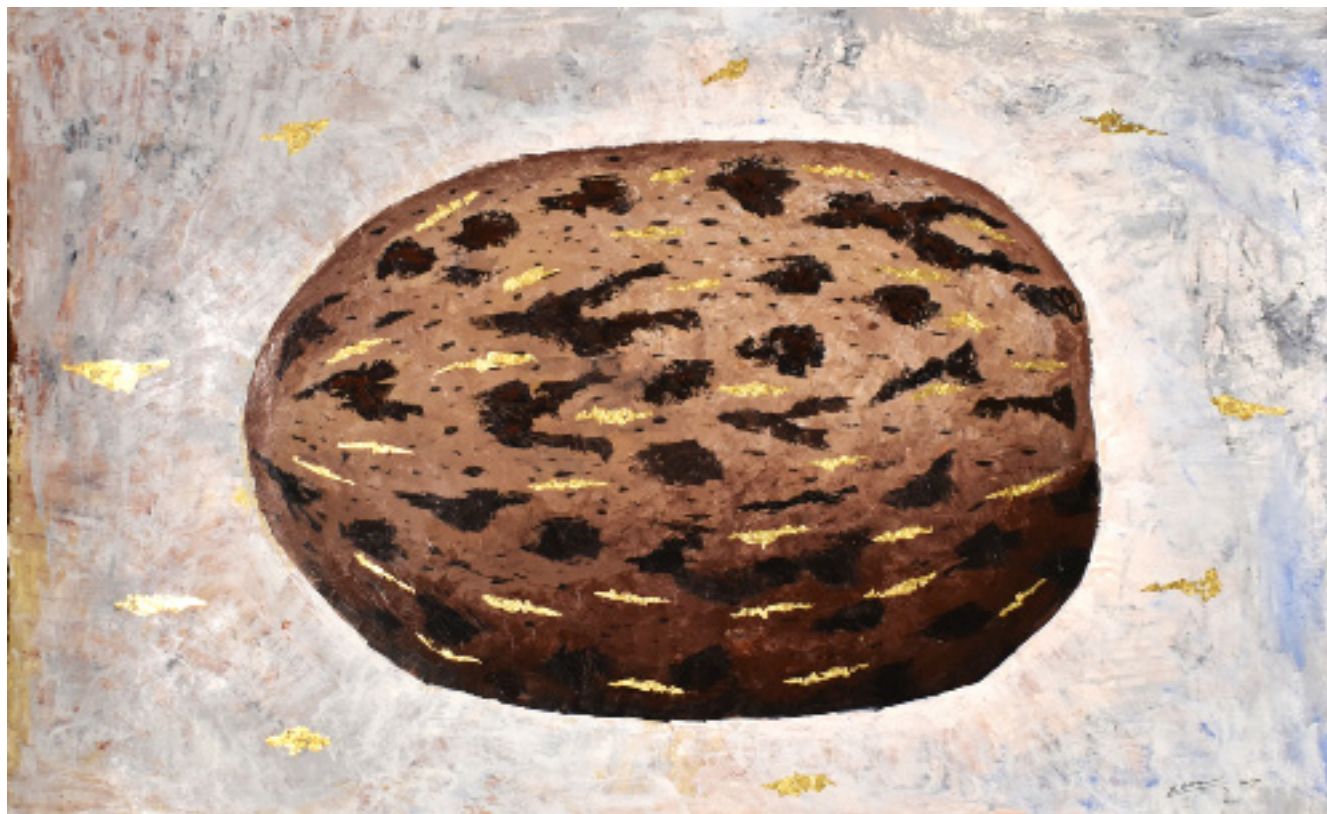
AMAZÔNIA / SERINGA ACRÍLICA SOBRE PAPEL 110 x 75 CM 2020 R$4.375