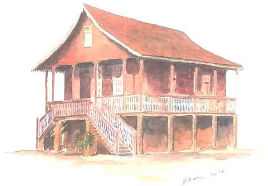
CASA COLONIAL GRAMADO, RS AQUARELA SOBRE PAPEL 35 x 40 CM 2020 R$1.875