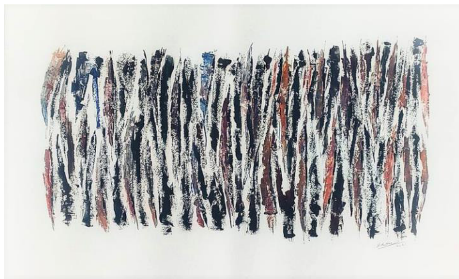
GOUACHE GOUACHE SOBRE PAPEL 110 x 75 CM 2021 R$4.625