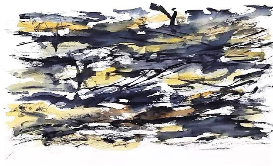
SEM TÍTULO AQUARELA SOBRE PAPEL 70 x 50 CM 2021 R$3.000