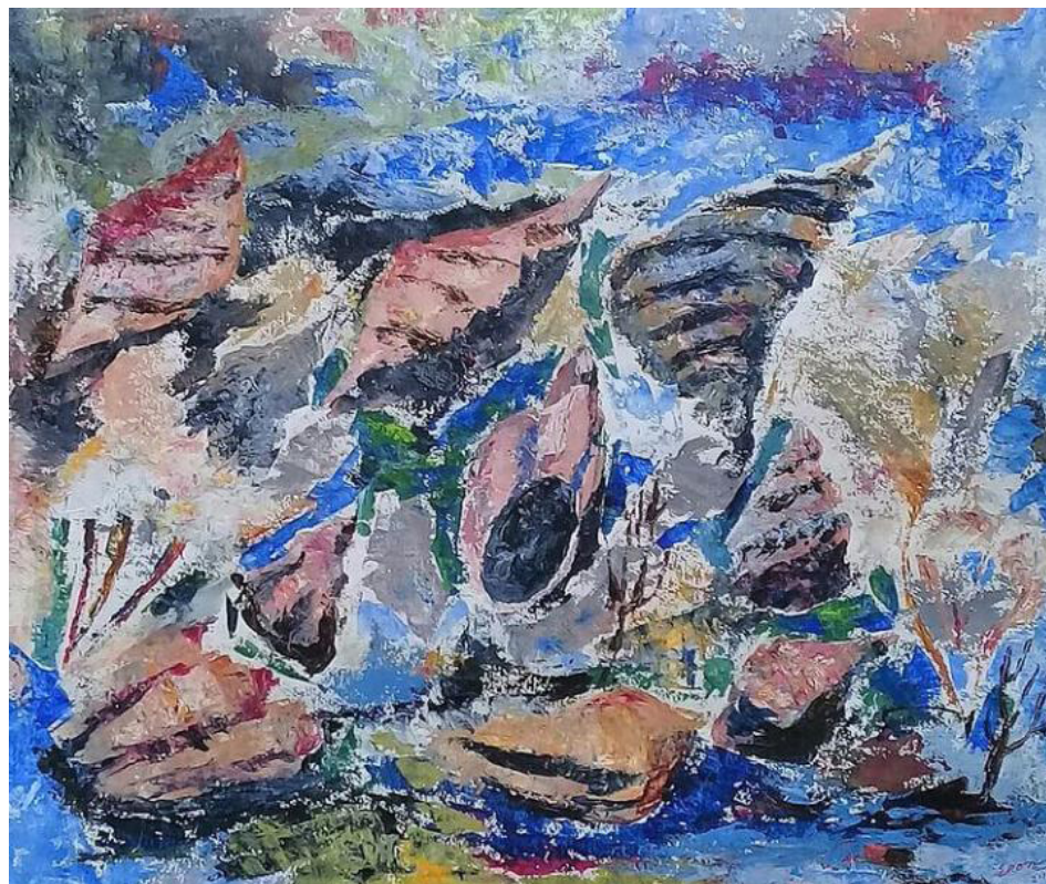
EL MARE ACRÍLICA SOBRE PAPEL 106 x 90 CM 2019 R$4.900