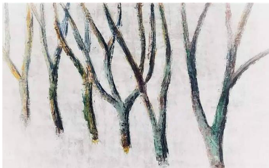
LANDSCAP ACRÍLICA SOBRE PAPEL 70 x 45 CM 2022 R$2.875