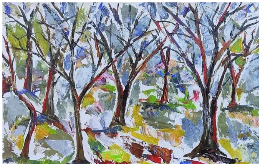
PAISAGEM DE INVERNO PORTO ALEGRE ACRÍLICA SOBRE PAPEL 70 x 45 CM 2019 R$2.875