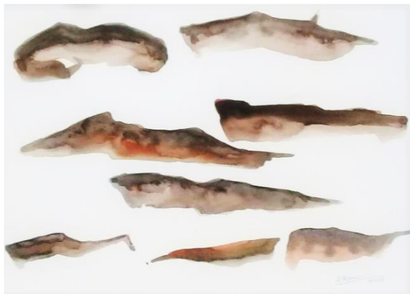
ESTUDO FORMAS AQUARELA SOBRE PAPEL 30 x 40 CM 2020 R$1.750