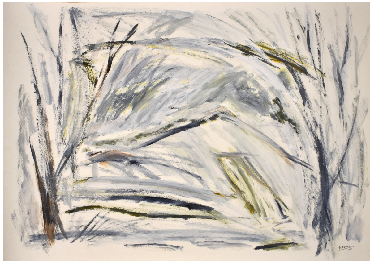
LANDSCAP PAPER ACRÍLICA SOBRE PAPEL 100 x 75 CM 2021 R$4.375