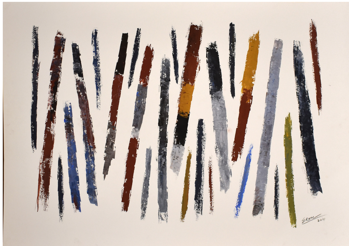
GOUACHE GOUACHE SOBRE PAPEL 110 x 75 CM 2021 R$4.625