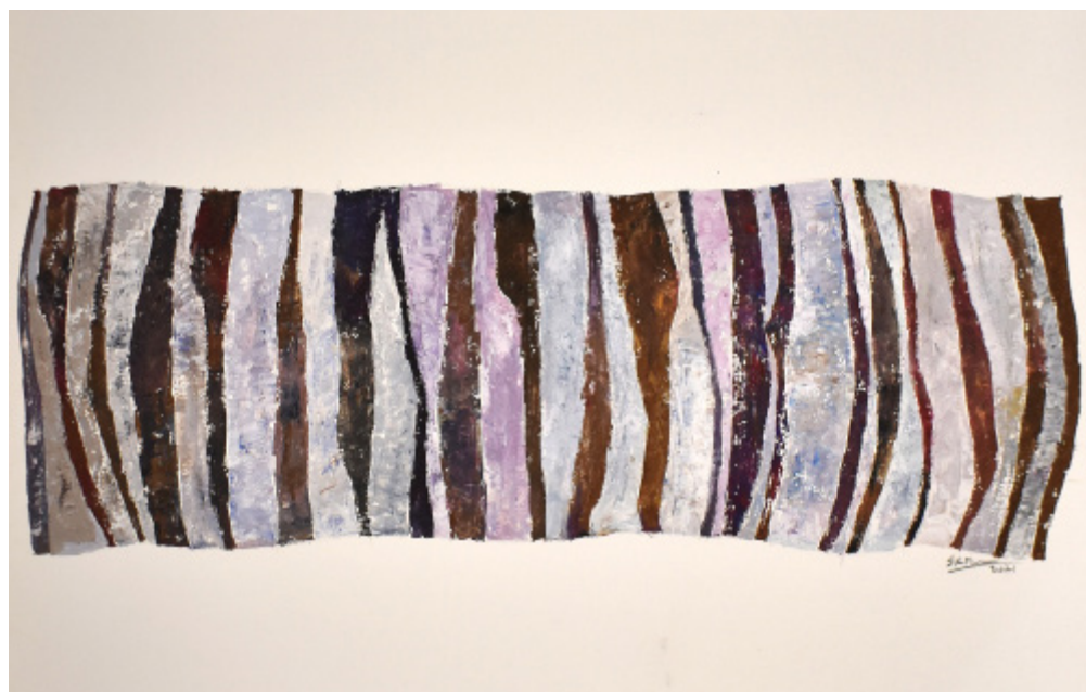
GOUACHE GOUACHE SOBRE PAPEL 110 X 80 CM 2021 R$4.750