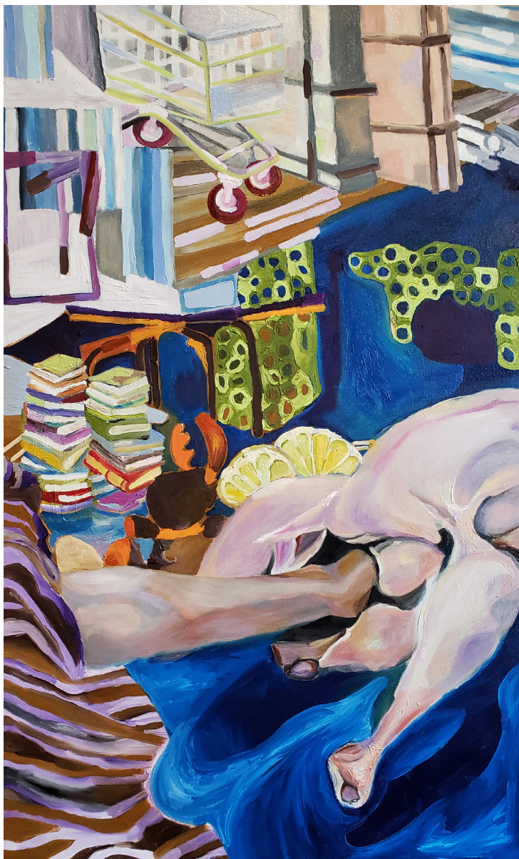
SITUAÇÃO 3# ÓLEO SOBRE TELA 50 x 80 CM 2020 R$5.900