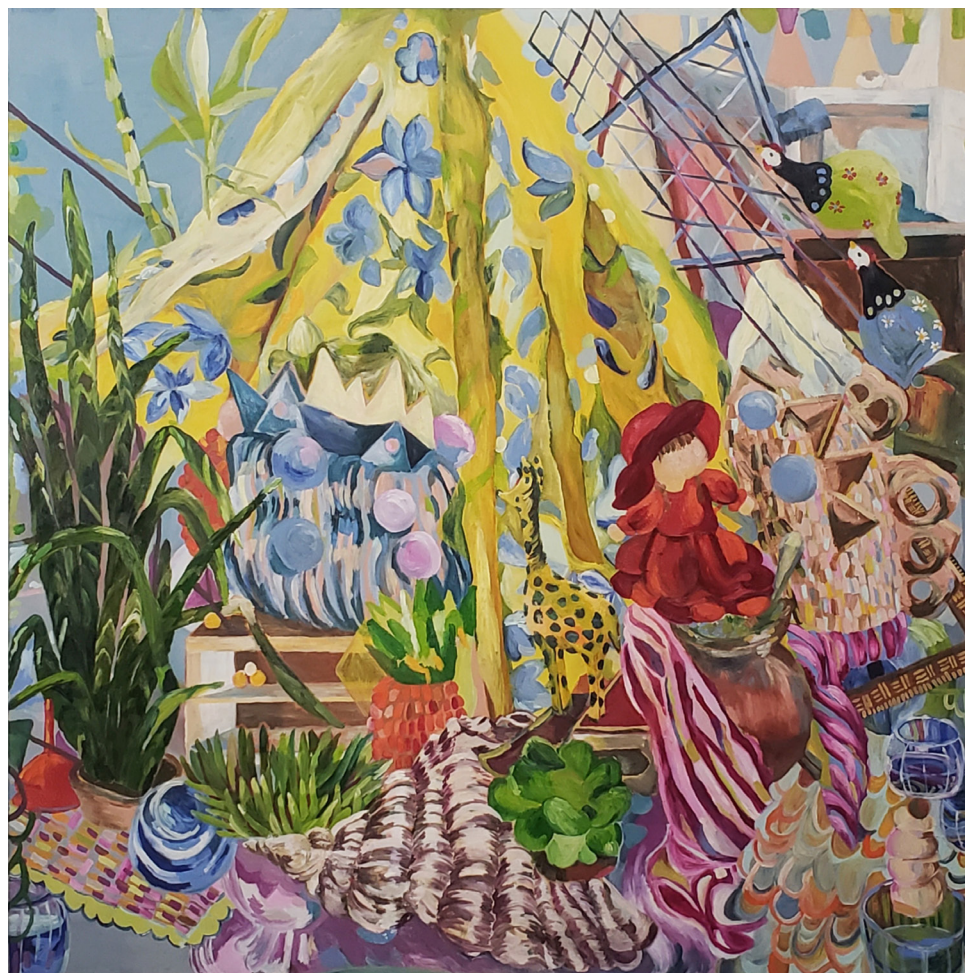
ARRANJO ÓLEO SOBRE TELA 100 x 100 cm 2022 R$7.500