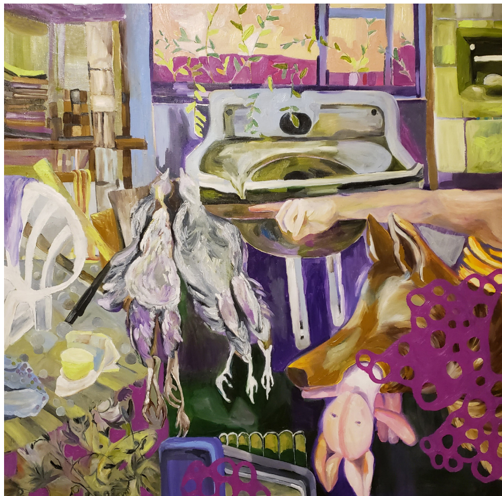
SITUAÇÃO 4# ÓLEO SOBRE TELA 80 x 80 CM 2020 R$4.500