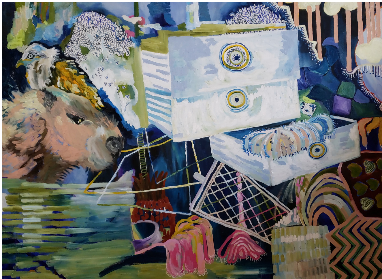
PAISAGEM DOMÉSTICA 3# ÓLEO SOBRE TELA 80 x 60 CM 2021 R$5.900