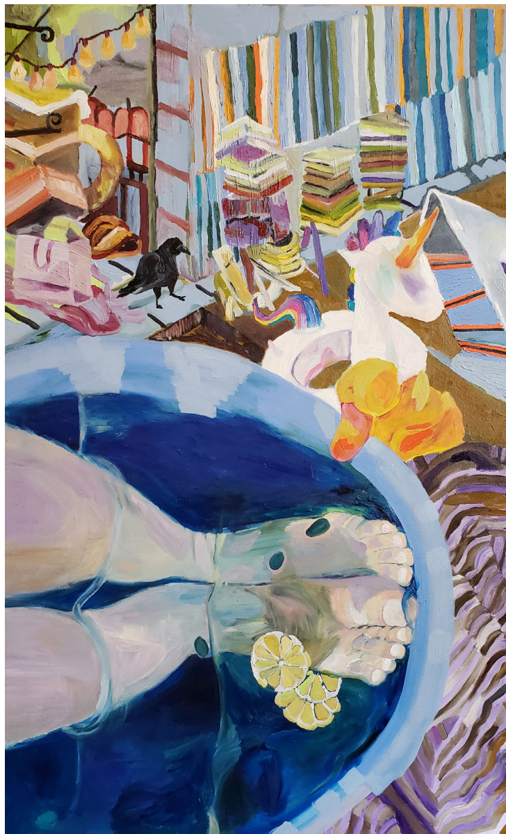
SITUAÇÃO 1# ÓLEO SOBRE TELA 50 x 80 CM 2020 R$5.900