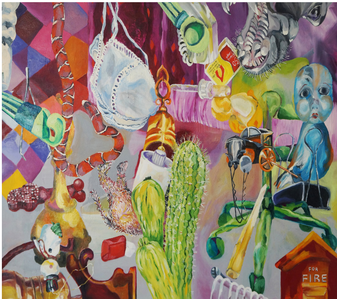
INVENTÁRIOS 4# ÓLEO SOBRE TELA 80 x 60 CM 2019 R$3.900